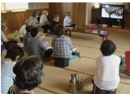
西田面町内会訪問 (地域ふれあい公民館)