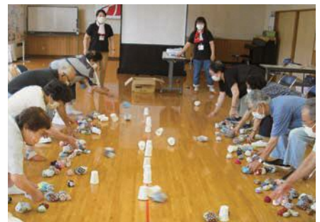
紙コップ倒しゲーム (湊みのりの大学)