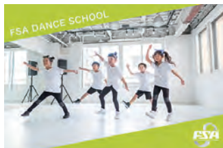
FSAダンサーズスクール