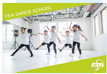
FSAダンサーズスクール